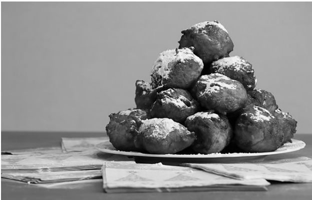
Oaljekoeken.