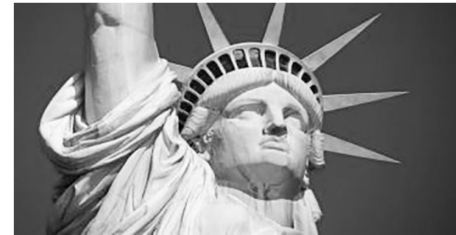
Frijheidsbyld New York, symboal fan frijheid.

As earder bûtengewoan amtner fan de boargerlike stân moast ik tinke oan de heisa dy't sa'n tweintich jier lyn ûntstie doe't yn ús lân it houlik tusken twa minsken fan itselde geslacht mooglik waard. Der wiene amtners dy't, út oertsûging oangeande harren godstsjinstich leauwen, sa'n houlik net slute woen. Dêr waard skande fan sprutsen. Dy amtners waarden ferkettere. It wie by wet regele en dêr moast eltse amtner oan foldwaan. Der kamen sels rjochtsaken. Yn Fryslân waard der sels in wurd foar betocht: ferpofamtner. Gjin minske dy't der ek mar in momint oan tocht dat der faaks ek wol pearkes wêze kinne dy't leaver net troude wurde wolle troch in amtner dy't ek homohouliken slút. It is faaks wat fier socht, mar wêrom soe it net kinne? Hawar, ek dy stoarm is wer lizzen gien. Der binne noch hieltyd bûtengewoan amtners fan de boargerlike stân dy't gjin houliken slute tusken twa minsken fan itselde geslacht.