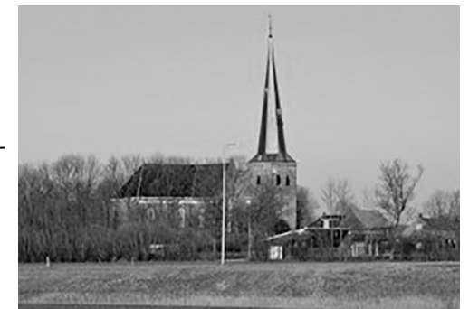
Holwert, Willibrordustsjerke.