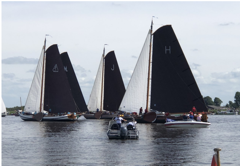
Skûtsjesilen op de Veenhoop